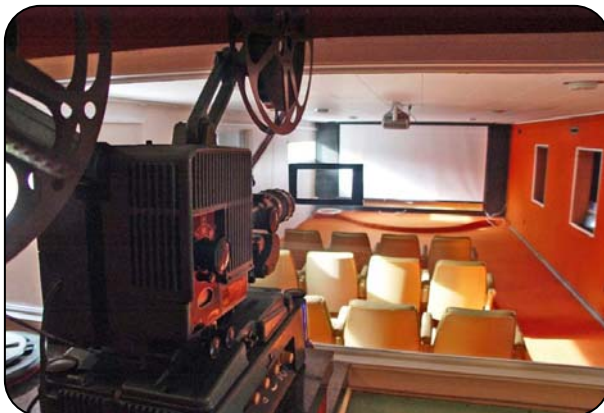
Salle de visionnement

5656 boul. De L'Assomption Montréal (Quebec) H1T 2M5 Canada